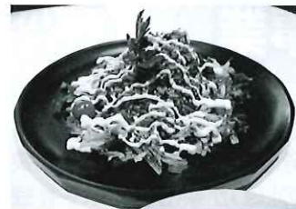
バルメニュー「ベジタコライス」